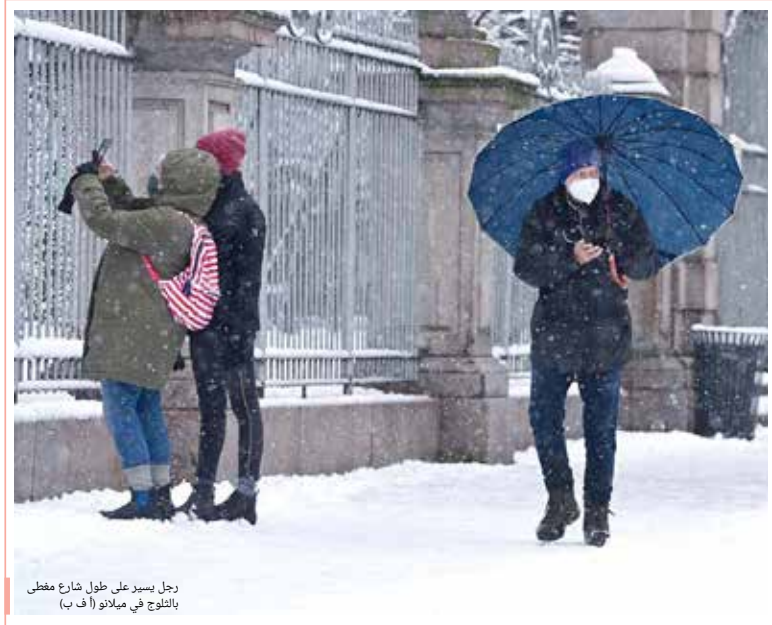
رجل يسير على طول شارع مغطى بالثلوج في ميلانو

إدارة التحرير: +973 17111444 +973 17111467 +973 385 Local @albiladpress.com 2008 • طلست سنة 2008 • مصر عن دار البلاد للصحافة والنشر والتوزيع • ص ب 67133 • طبع في مؤسسة عالم سفر • قسم الإعلانات: 508 / 1711501 +973 39615645 / 32224492 +973 17580939 • الاشتراكات والتوزيع: +973 17111432 • طبع في مؤسسة عالم سفر +973 17111434