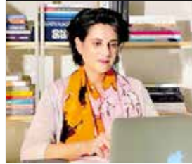
الشبيخة هلا بنت محمد آل خليفة

واجهة وتمعناً أساسياً يوازي في جماله عمارة المتحف الوطني، وقد تم إنشاؤه بدعم سخى من حضرة صاحب الجلالة الملك حمد بن عيسى آل خليفة ملك البلاد المفدى تحت مظلة مشروع الاستمرار في الثقافة.