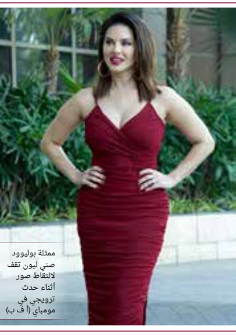
ممثلة بوليوود صني ليون تقف لالتقاط صور أثناء حدث ترويجي في مومباي

لقي الزوج والزوجة، دايب برايات، ونانسي برايات، من مدينة نيو هامبشر الأميركية قطعها المحبوب بعد مرور 7 أعوام من فقده. وأقارت صحيفة "يو بي آي" الأميركية، أن القط المسمى "باني" سلمته للزوجين ابنة صديقهما حين قررت عام 2011 الطغوع للخدمة في الجيش الأميركي، وقال الزوجان إن الحيوان الأليف كان حنونا ووديدا جدا منذ البداية. وبعد مرور عامين تقريبا، خرج باني للزوجة ولم يعد إلى البيت. وبعد مرور 7 أعوام من فقده، لقي مارة قطا في مطلع ديسمبر الجاري، فنقلوه إلى ملجأ محلي للحيوانات حيث فحصته إدارة الملجأ واكتشفت لديه رقاقة إلكترونية مغلقة على جسمه أظهرت أن القط هو ملكة لأبنة صديقهما. فالتصفت الإدارة بالفتاة التي ما زالت تتحدف في الحيش والتي ساعدتها في الاتصال بعائلة برايات.