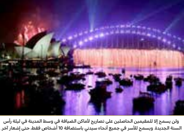
ولن يسمح إلا للمقيمين الحاصلين على تصاريح الأماكن السياحية في وسط المدينة في ليلة رأس السنة الجديدة ويسمح للسر في جميع أنحاء سيدني باستضافة 10 أشخاص فقط، حتى إشعار آخر.

حظرت سيدني، وهي من أوائل المدن في العالم التي تستقبل كل عام جديد بالعد التنازلي الذي يضم عرضا مشيرا للألعاب النارية فوق دار الأوبرا، التجمعات في تلك الليلة، وسط تشفي فيروس كورونا. وحذرت رئيسة وزراء مقاطعة نيو ساوث ويلز، غلاديس بريجيكليان، معظم الناس من القدوم إلى وسط مدينة سيدني (أستراليا) في تلك الليلة، مشيرة إلى أن التجمعات الخارجية يجب أن تقتصر على 50 شخصا. وقالت بريجيكليان في مؤتمر صحفي أمس الاثنين: "مشاهدة الألعاب النارية من المنزل أكثر أمانا". في ليلة رأس السنة الجديدة، لا يزيد أي حشود على الشاطئ الأمامي حول سيدني على الإطلاق.